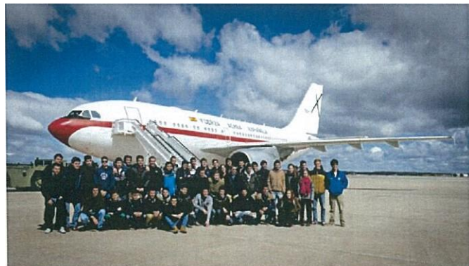
VISITA AL 45 GRUPO - CURSO 2014/15

Has elegido el mejor Centro de España. No va a ser fácil ... pero lo conseguiremos entre todos.